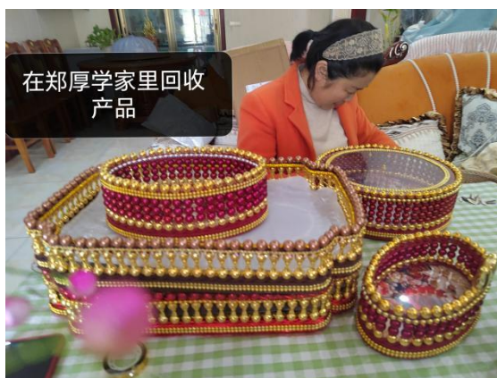
在郑厚学家里回收产品