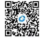
扫码关注“全国公共资源交易”