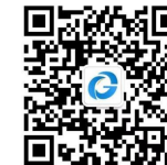
扫码关注“全国公共资源交易”