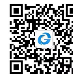
扫码关注“全国公共资源交易”