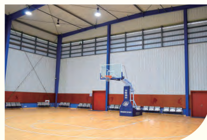
室内国际标准篮球场