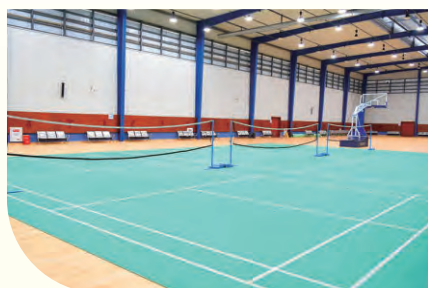
室内国际标准羽毛球场