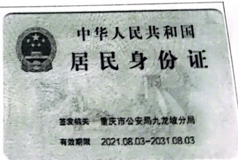
委托代表人身份证反面