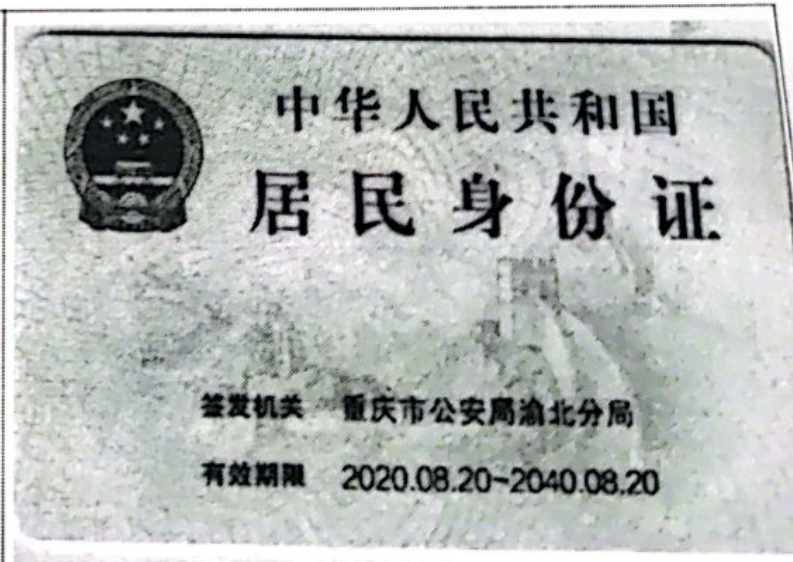
法定代表人身份证反面