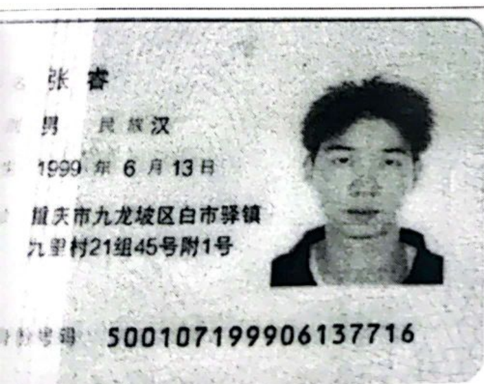
委托代表人身份证正面