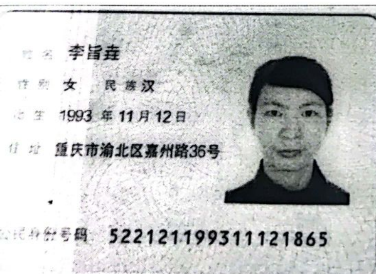
法定代表人身份证正面