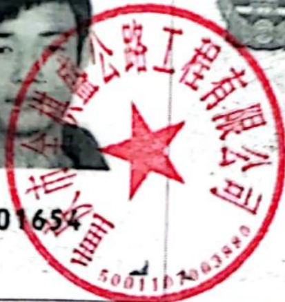
委托人身份证反面