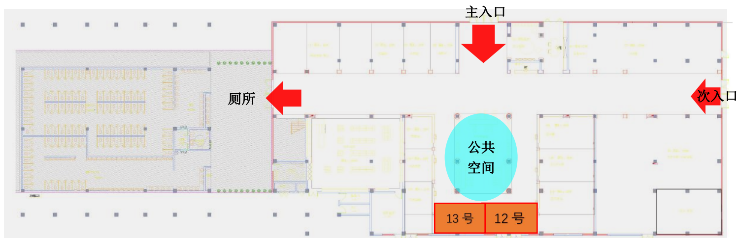
大观东区 (回城方向)