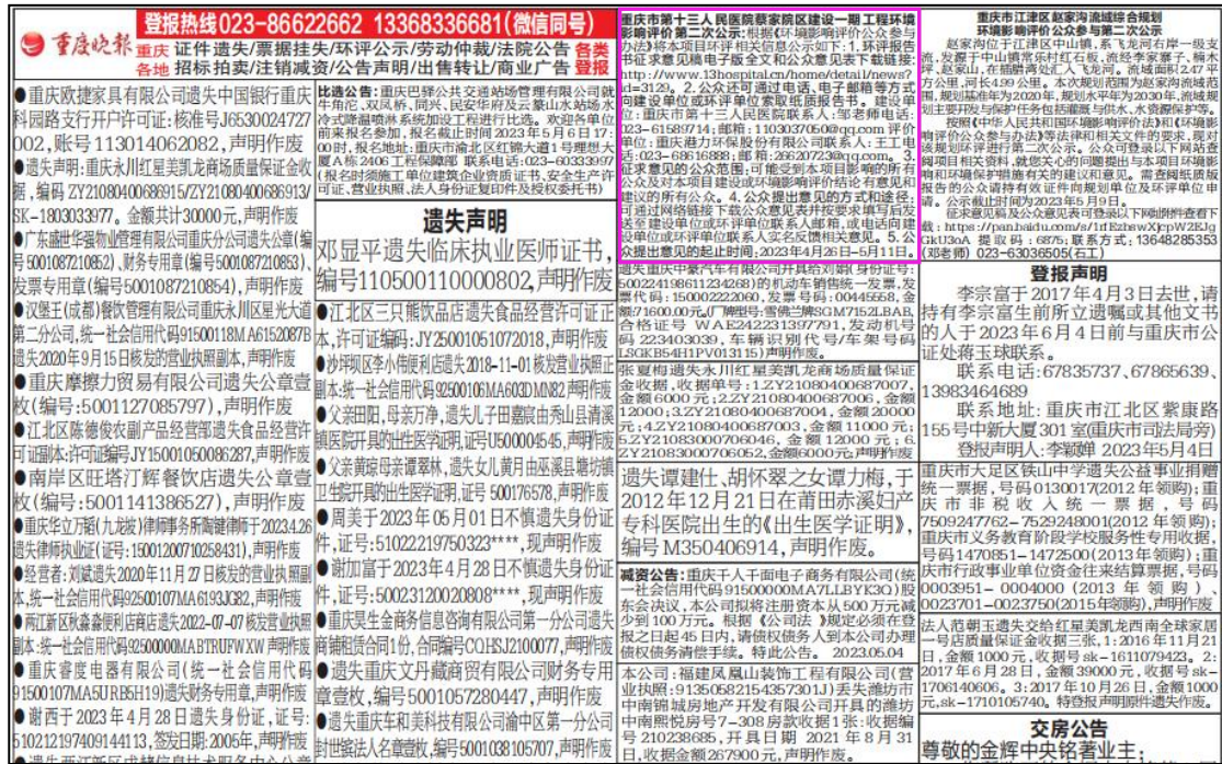
图 3.2-3 2023 年 5 月 4 日重庆晚报公示截图