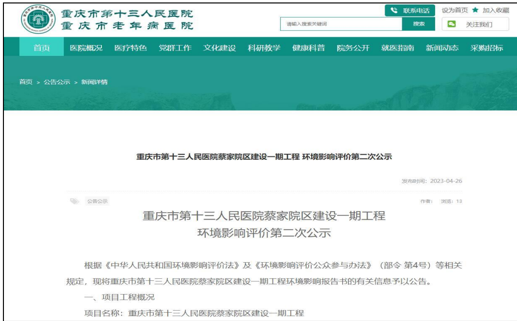
图 3.2-1 第二次网络公示截图