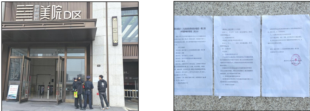
图 3.2-6 场址附近金科金辉美院 D 区小区出入口现场公告