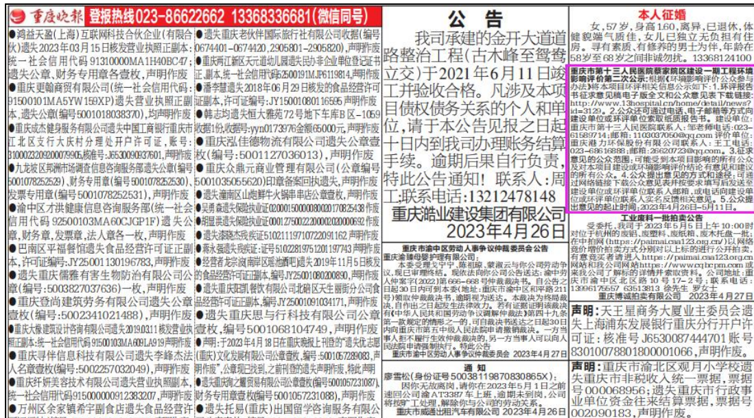
图 3.2-2 2023 年 4 月 27 日重庆晚报公示截图

《重庆晚报》为面向大众的重庆本土综合性都市报，面向重庆 38 个区县、以及全国和海外发行。项目位于重庆市主城区北碚区，项目使用主城区知名的重庆晚报刊登项目公示内容，载体选择符合《环境影响评价公众参与办法》（生态环境部令第 4 号）要求。