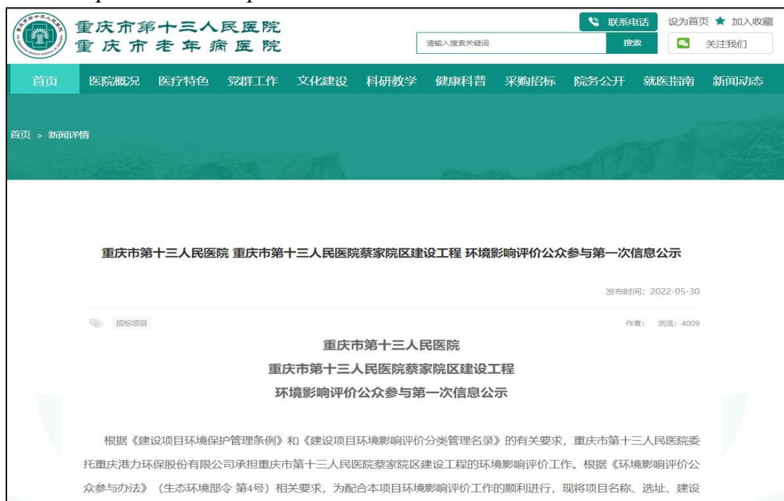
图 2.2-1 第一次网络公示截图

第一次环境影响评价信息公开采用网络公示，公示地址为医院官网，链接： http://www.13hospital.cn/home/detail/news?id=2732 。