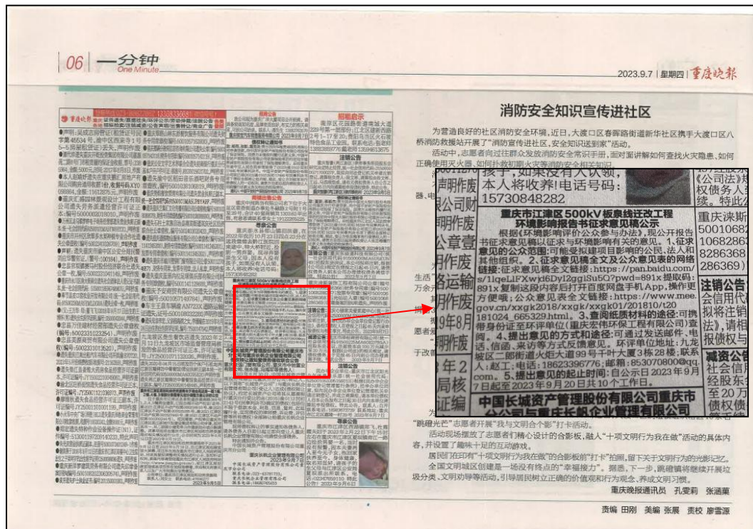
图 3-2 重庆晚报公示截图（9月7日）

我公司于2023年9月7日、2023年9月12日共两次在“重庆晚报”刊登环评公示信息，公布公众参与公示内容的获取方式以及建设单位及评价单位联系人联系方式。报刊版面如下图：