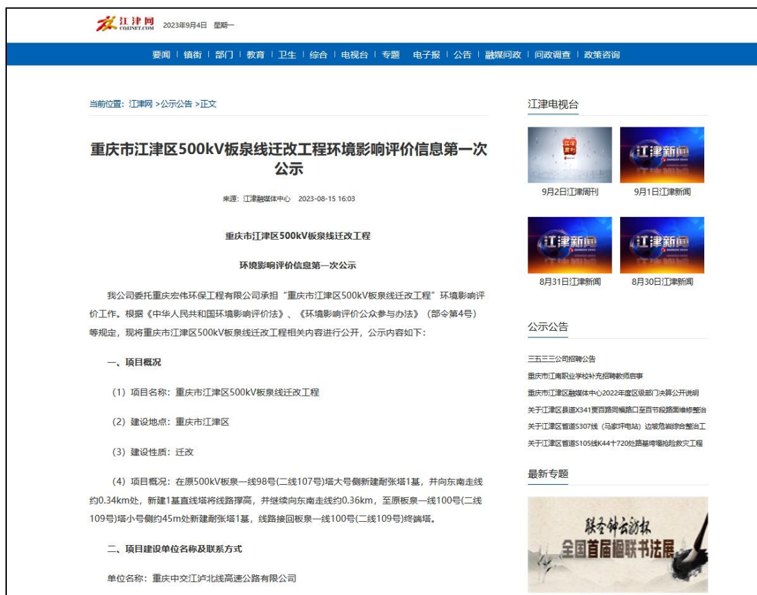
图2-1 首次网络公示截图