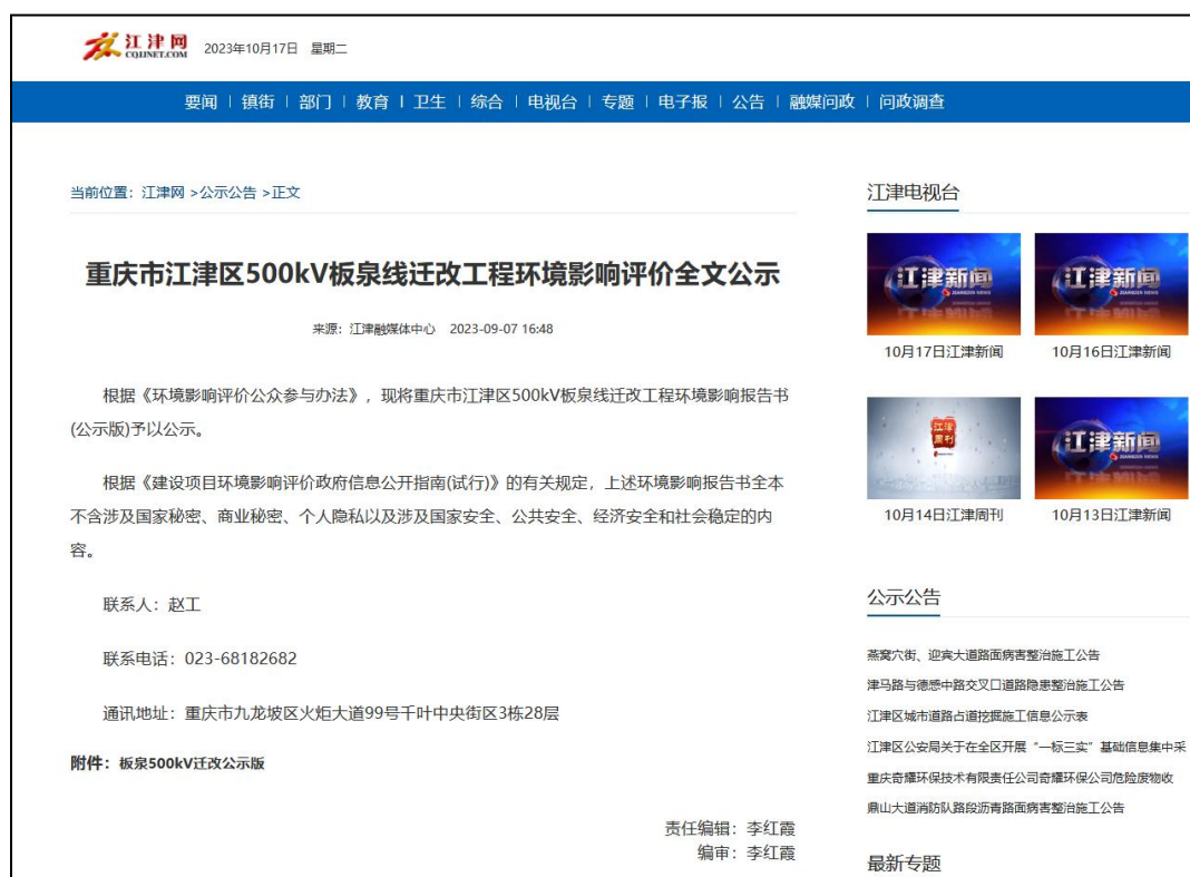
图3-1 征求意见稿网络公示截图